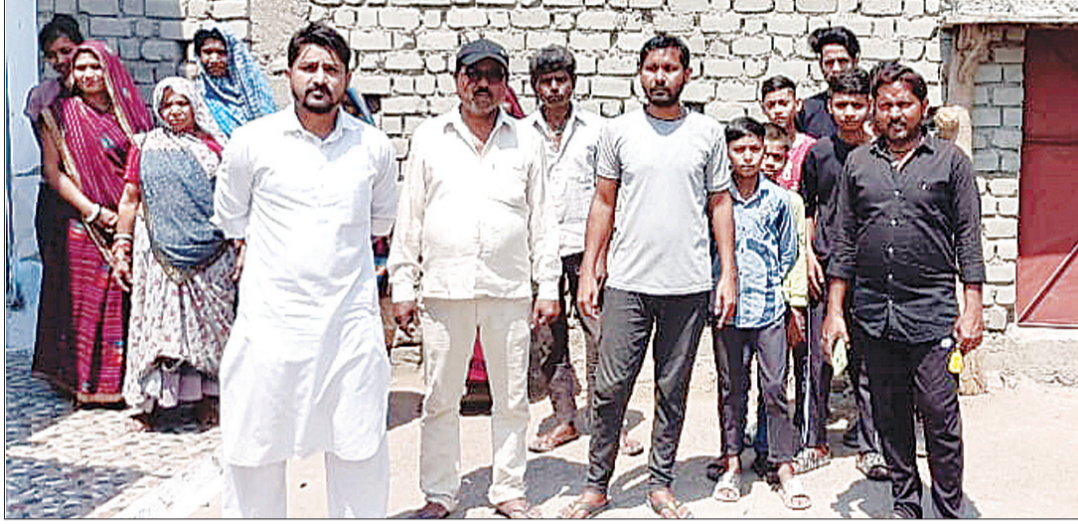
कहना है कि जब तक इस समस्या का समाधान नहीं होगा तो आने वाले 19 तारीख को लोकसभा के चुनाव का सामूहिक रूप से बहिष्कार करेंगे क्योंकि प्रशासन भी हमें अभी तक अनदेखा करती आ रही है।

सामुदायिक स्वास्थ्य केंद्र धनुपुरी के द्वारा लगभग 60 वर्ष से जो सड़क निरंतर रूप से चालू थी उसे बंद कर दिया गया है जिससे वहां के रहवासी में जमकर रोष है। धनुपुरी।